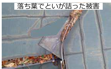
落ち葉でといが詰った被害