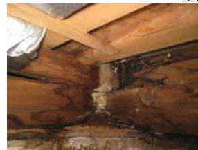
建物の構造材を腐食 させてしまう