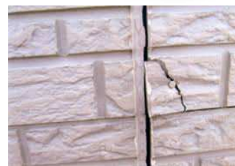
壁から雨が浸みてきた被害