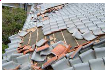
瓦のヒビ 割れ ずれ はがれから 風で瓦が飛ばされた被害